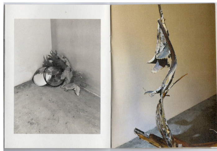
Publicação especialmente realizada pelo artista Pablo Capitán del Río durante a Residência Paulo Reis. Publication specially created by the artist Pablo Capitán del Río, during the Paulo Reis Residency.