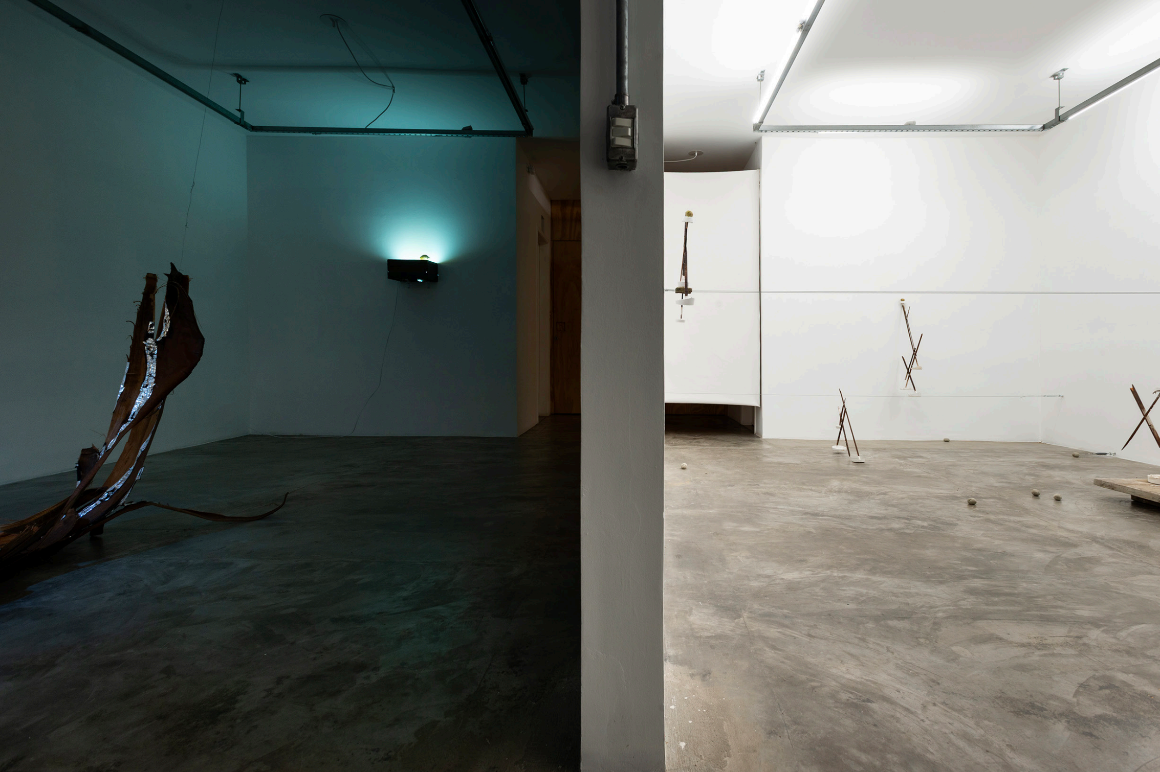
A Siesta das Plantações, 2026, vista geral da exposição | A Siesta das Plantações, 2026, general view of the installation