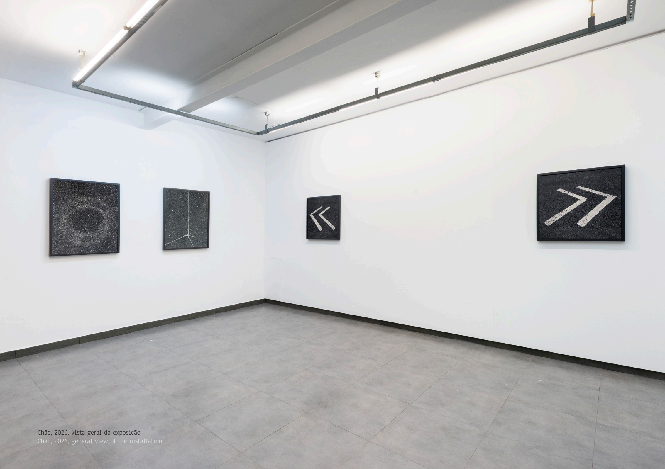
Chão, 2026, vista geral da exposição Chão, 2026, general view of the installation