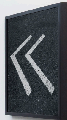
(Da esquerda para a direita) Siena, série Chão, 2026, fotografia digital, impressão jato de tinta pigmentada, sobre papel de algodão, 80 x 60 cm. Pisa, série Chão, 2026, fotografia digital, impressão jato de tinta pigmentada, sobre papel de algodão, 80 x 60 cm. (From left to right) Siena, from the Chão series, 2026, digital photograph, pigment inkjet print on cotton paper, 80 x 60 cm. Pisa, from the Chão series, 2026, digital photograph, pigment inkjet print on cotton paper, 80 x 60 cm.