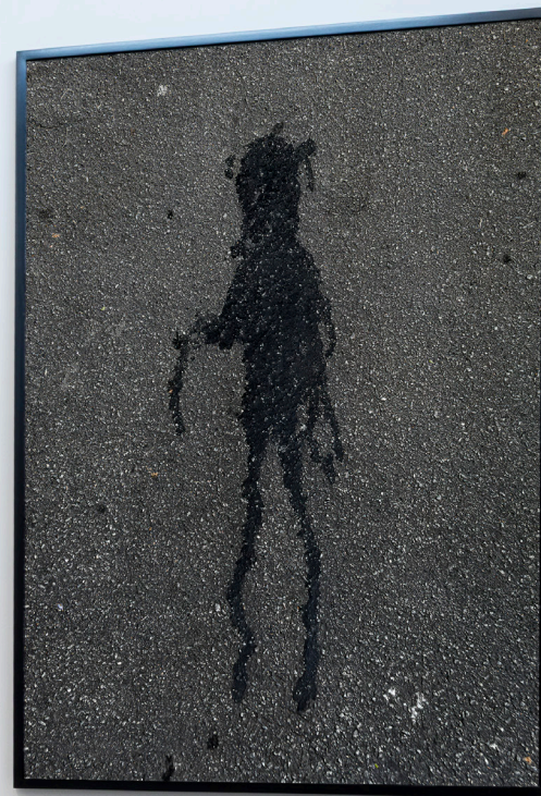
(Da esquerda para a direita) Nova York #2, série Chão, 2026, fotografia digital, impressão jato de tinta pigmentada sobre papel de algodão, 60 x 60 cm. São Paulo, série Chão, 2026, fotografia digital, impressão jato de tinta pigmentada sobre papel de algodão, 150 x 100 cm. (From left to right) Nova York #2, from the Chão series, 2026, digital photograph, pigment inkjet print on cotton paper, 60 x 60 cm. São Paulo, from the Chão series, 2026, digital photograph, pigment inkjet print on cotton paper, 150 x 100 cm.