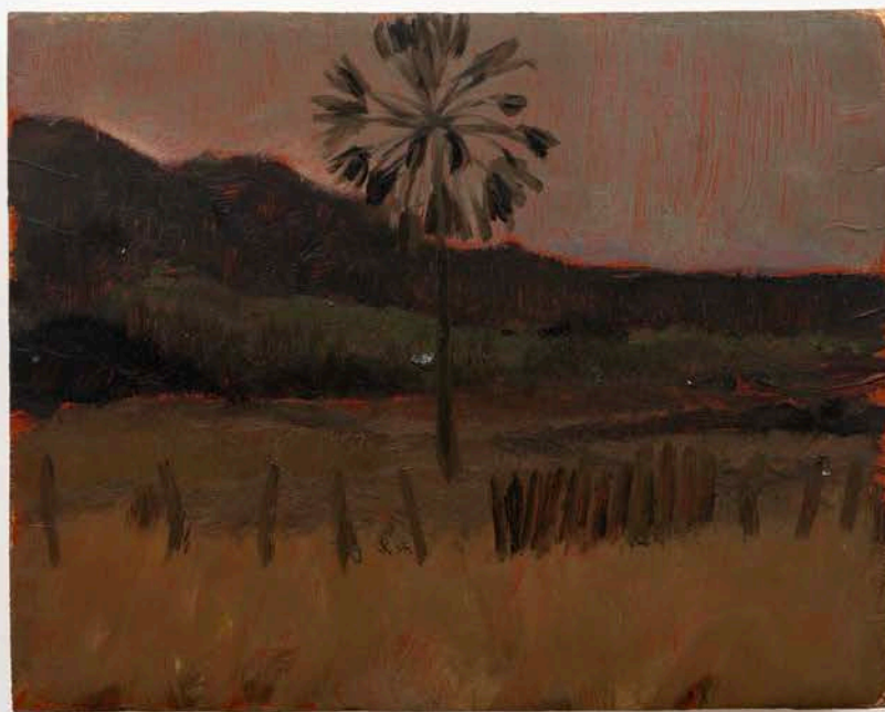
David Almeida. Carnaúba, 2019. Óleo sobre madeira preparada com bolo armênio | Oil on wood prepared with Armenian bole