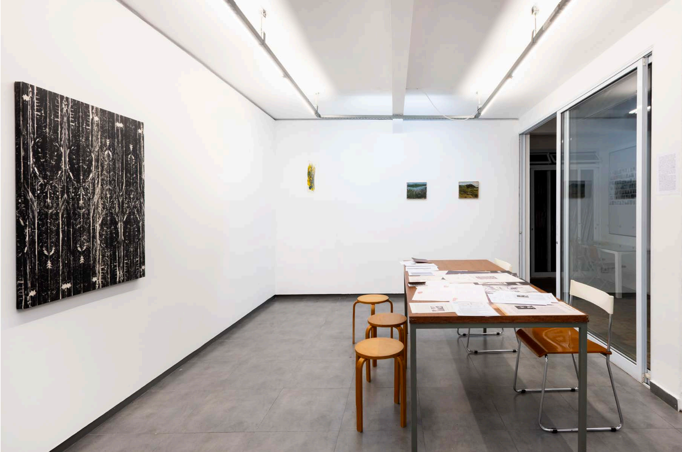
Percursos Sutis: Natureza, Memória e Transformação , vista geral da exposição, Sala Aquário | Percursos Sutis: Natureza, Memória e Transformação , 2024, general view of the exhibition, Aquarium Room