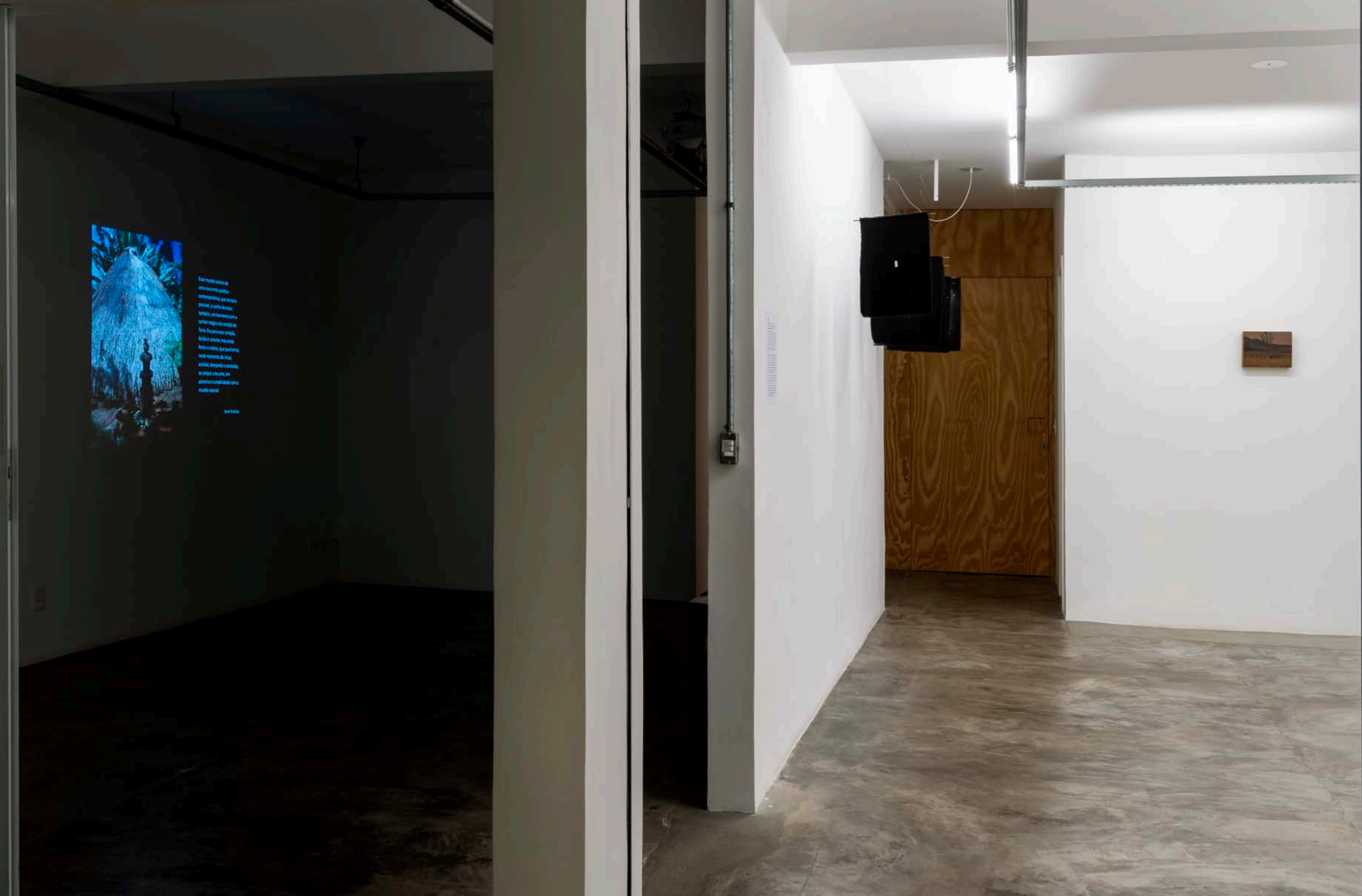
Percursos Sutis: Natureza, Memória e Transformação , vista geral da exposição, Sala Espelho | Percursos Sutis: Natureza, Memória e Transformação , 2024, general view of the exhibition, Mirror Room