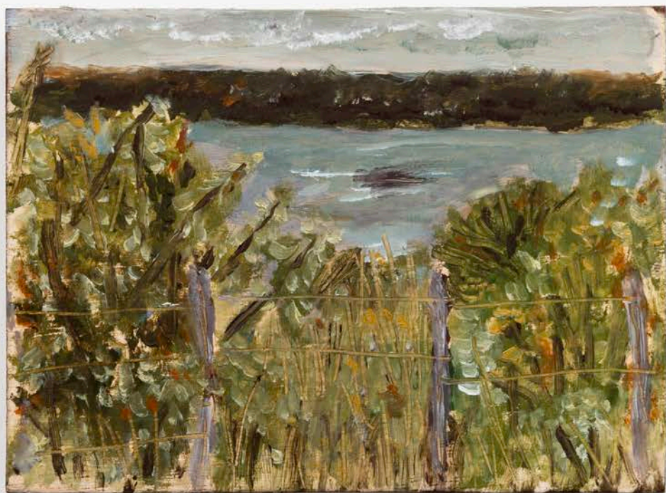
David Almeida. Cerca, 2019. Óleo sobre madeira | Oil on wood