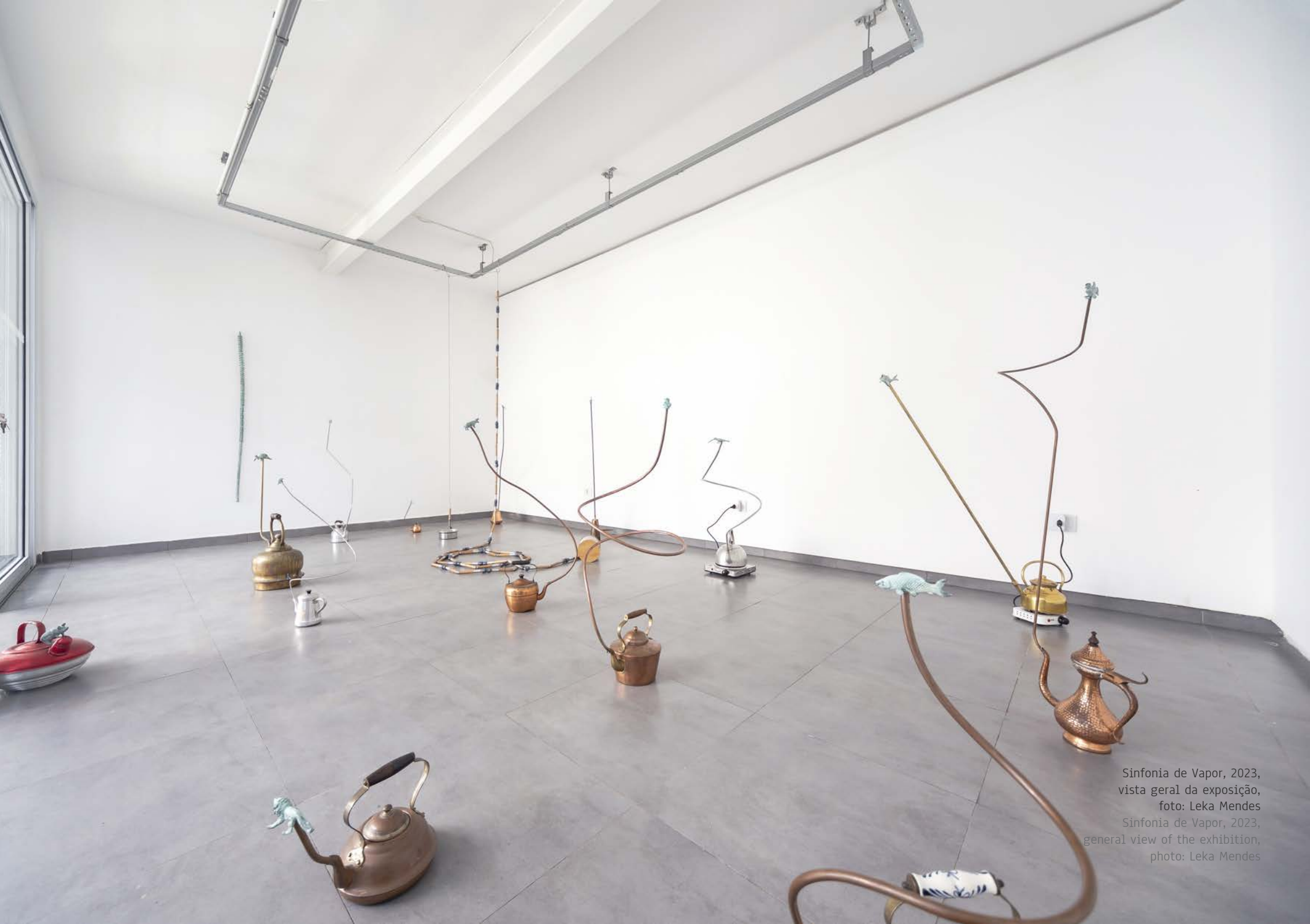
Sinfonia de Vapor, 2023, vista geral da exposição, foto: Leka Mendes