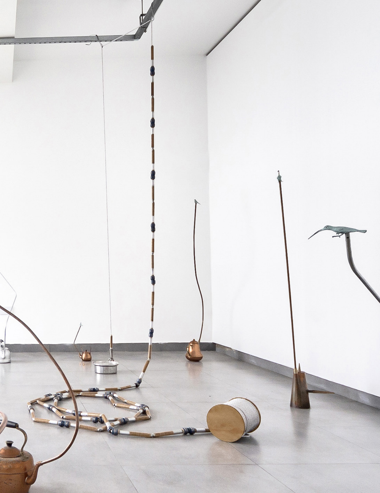
Sinfonia de Vapor, 2023, vista geral da exposição, foto: Leka Mendes Sinfonia de Vapor, 2023, general view of the exhibition, photo: Leka Mendes