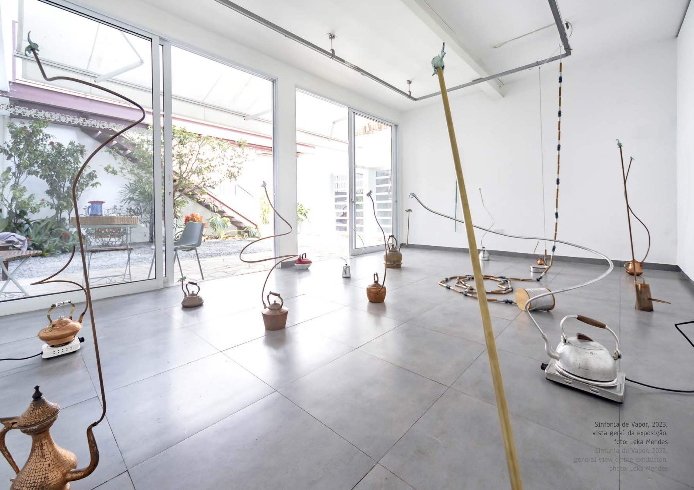
Sinfonia de Vapor, 2023, vista geral da exposição, foto: Leka Mendes Sinfonia de Vapor, 2023, general view of the exhibition, photo: Leka Mendes