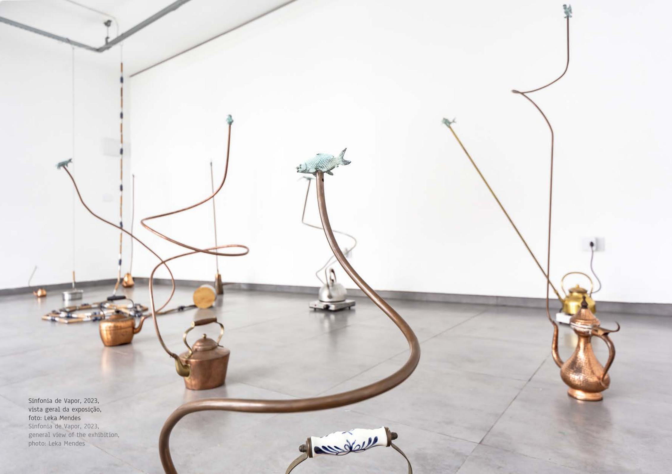
Sinfonia de Vapor, 2023, vista geral da exposição, foto: Leka Mendes