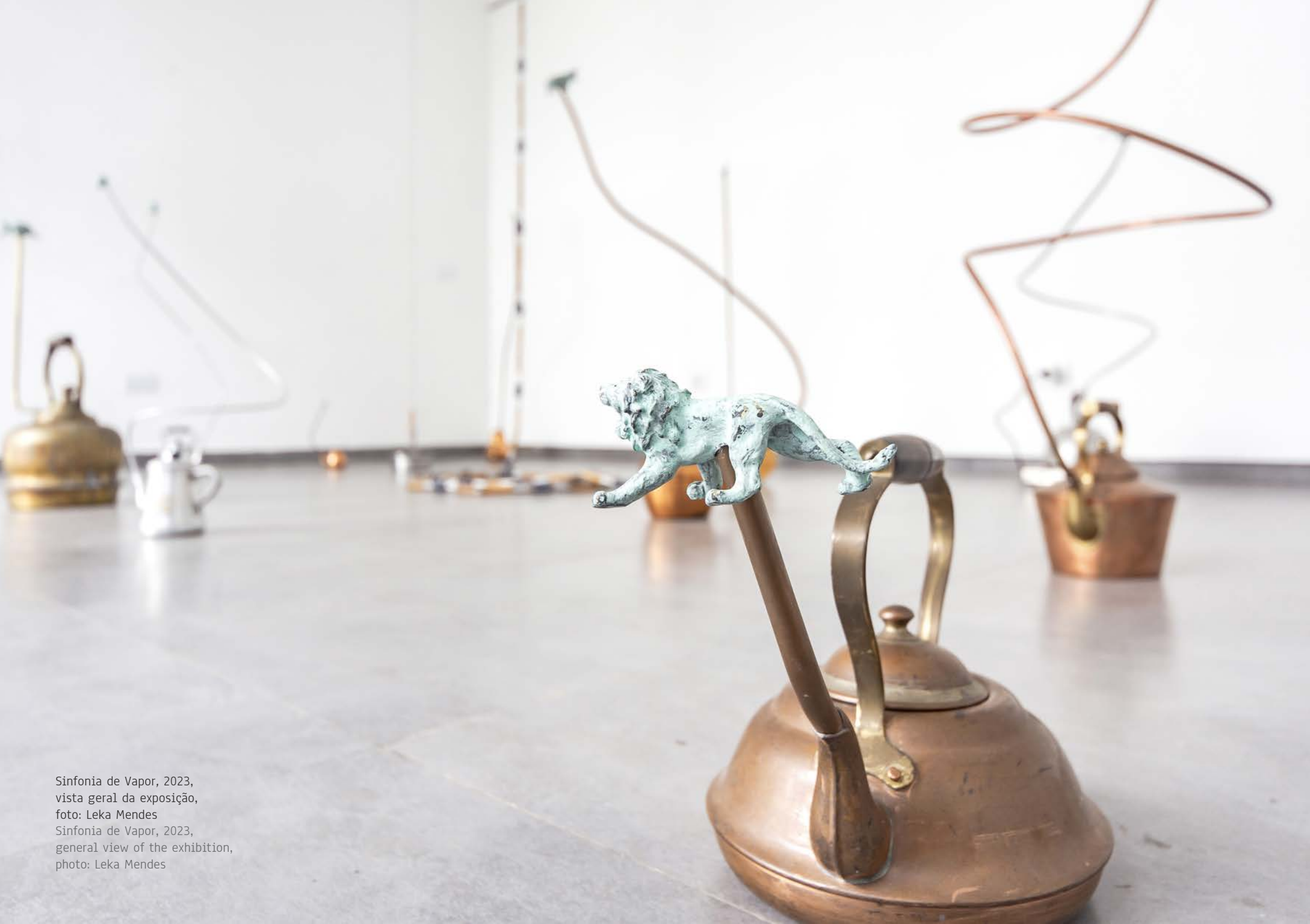
Sinfonia de Vapor, 2023, vista geral da exposição